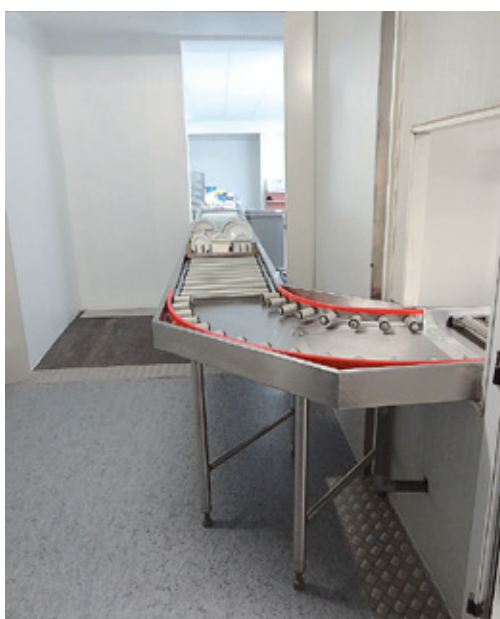
TABLE À ROULEAUX ENTRÉE MACHINE À LAVER